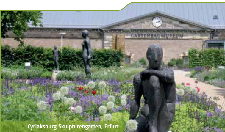
Cyriaksburg Skulpturengarten, Erfurt

Ihre Verkehrsunternehmen im Verkehrsverbund Mittelthüringen